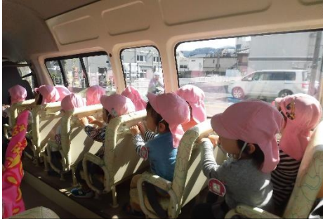
2歳児さんはバスで黄檗公園へ！

戸外へのお出かけが気持ちいい季節！青く高い空、風の香り、落ち葉や木の実などの素材、秋ならではの草花や昆虫。宇治の町の景色。様々な出会いが楽しいね