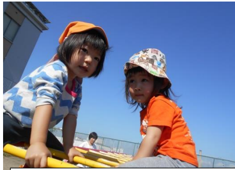
高い空にアキアカネ。爽やかな気候に活動意欲いっぱいの子どもたち！